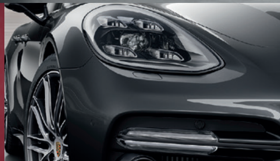
LED-Hauptscheinwerfer mit 4-Punkt-Tagfahrlicht