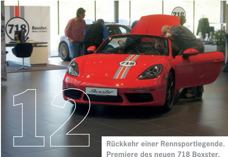
Rückkehr einer Rennsportlegende. Premiere des neuen 718 Boxster.