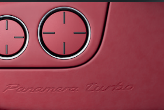
Großzügiges Raumkonzept für mehr Komfort

* In Verbindung mit optionalem Sport Chrono Paket mit Launch Control